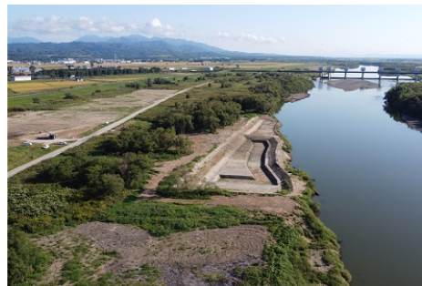
石狩川改修工事の内 北村雁里地区下流攪拌土造成工事