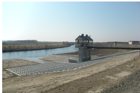
石狩川改修工事の内 カリンバ樋門改築外工事

『石狩川改修工事の内 北村遊水地排水門工事』社員向けの現場見学会で流域治水を学びました 令和7年度「流域治水を学ぶ」現場見学会を開催しました