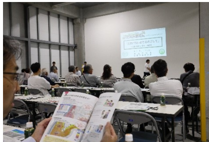
流山市による防災セミナー