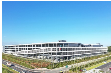
防災協定を締結している物流施設「DPL流山Ⅳ」外観

防災協定を締結している物流施設「DPL流山Ⅳ」は、地域の方々の災害時の一時避難場所として活用しており、2025年5月に流山市後援のもと防災イベント「ソナエル防災in流山」を開催。約50名の近隣住民に参加いただき、集中豪雨や台風などの発生を想定した物流施設内への車両による避難体験や、VR（仮想現実）・AR（拡張現実）技術を採用した防災体験等を実施しました。