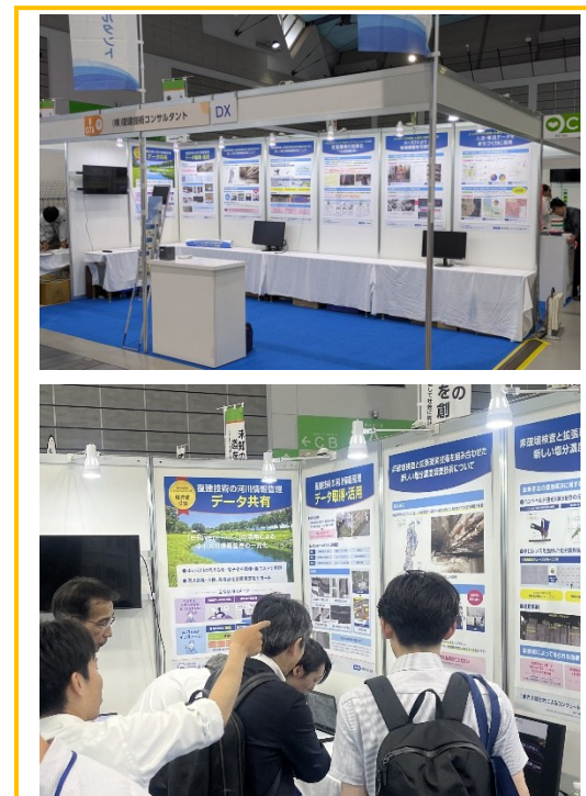
②「EE東北'25」弊社ブースの様子