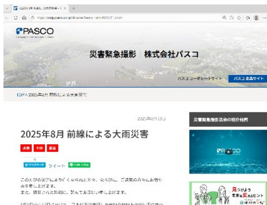
災害緊急撮影ホームページ

※URL： https://corp.pasco.co.jp/disaster/