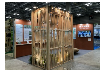
グリーンインフラ産業展