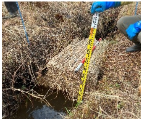
水位回復試験（茅堰）

岡山県真庭市蒜山地域の自然共生サイトにおいて、蒜山自然再生協議会と共同で半自然草原および湿地の再生・保全に取り組んでいます。環境調査や水位回復試験（茅堰）、山焼き支援などを通じ、水の貯留・浸透機能を高め、下流域へとつながる流域全体の水循環機能の向上を図っています。