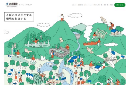
特設WEBサイト「ネイチャーポジティブ」開設 大成建設ネイチャーポジティブ