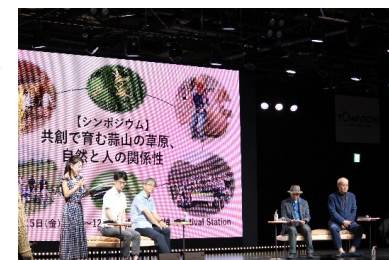
大阪・関西万博 真庭市主催イベント