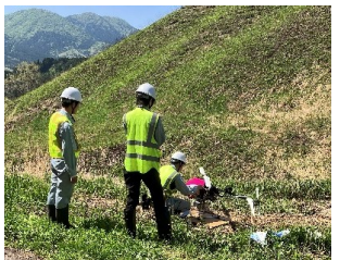
ドローンによる地形測量