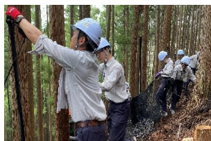
研修によるシカ柵設置