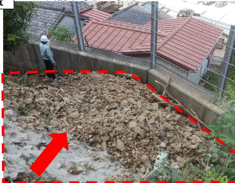
急傾斜地崩壊防止施設 (落石防護柵及び擁壁)