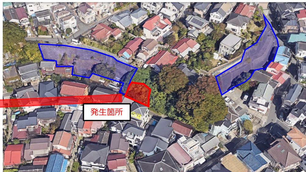
急傾斜地崩壊防止施設