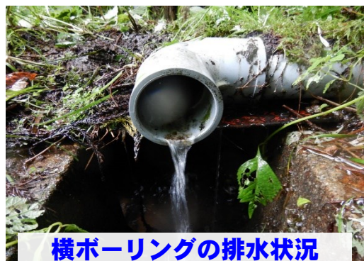
横ボーリングの排水状況