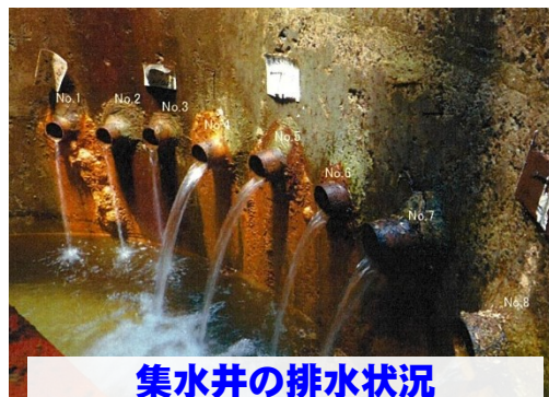
集水井の排水状況