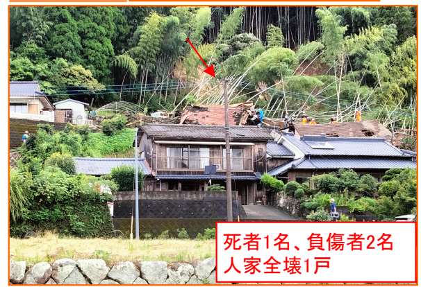
死者1名、負傷者2名 人家全壊1戸