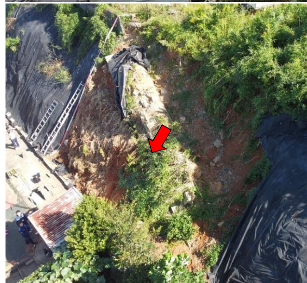
斜面の崩壊状況(全景)