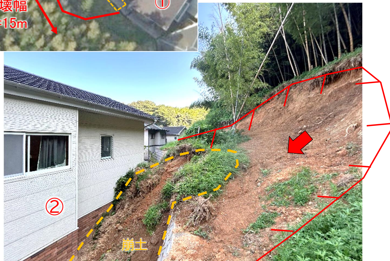
斜面の崩壊状況(近景)