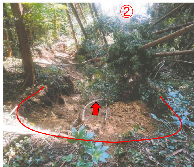
斜面の崩壊状況(頭部から崖下を望む)