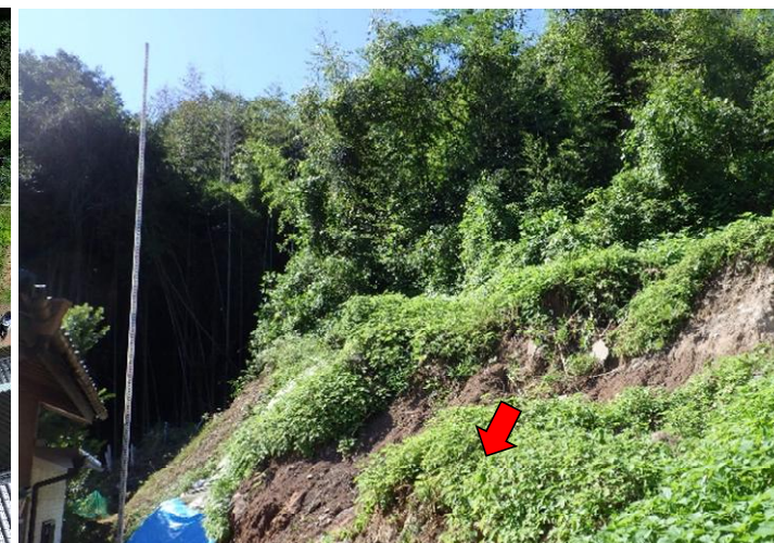
斜面の崩壊状況(滑落崖)