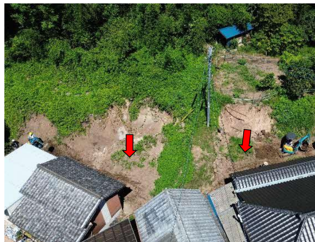
斜面の崩壊状況(全景)