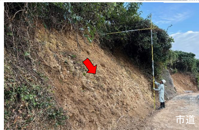
斜面の崩壊状況(近景)