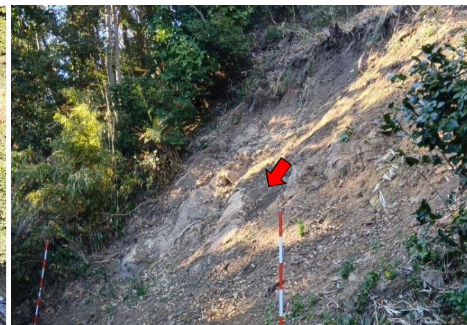
斜面の崩壊状況(滑落崖)