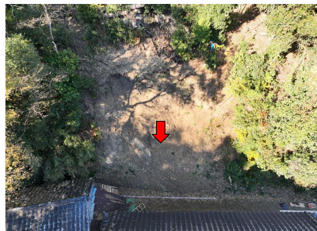
斜面の崩壊状況(正面)