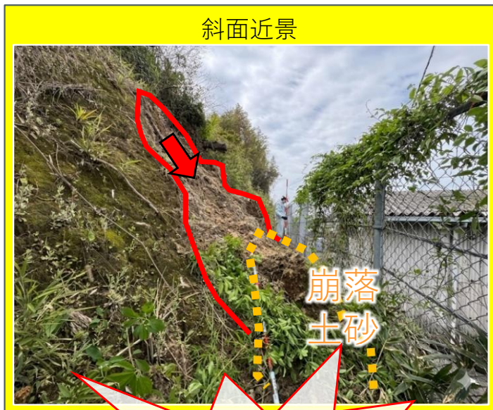
がけ崩れ発生状況・崩落土砂捕捉状況・・・4月13日撮影