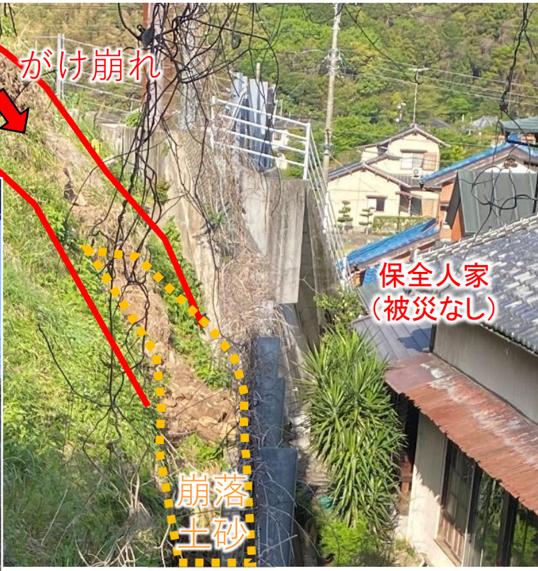
がけ崩れ発生状況・崩落土砂捕捉状況・・・4月17日撮影