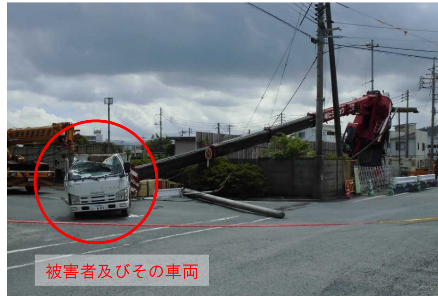
被害者及びその車両