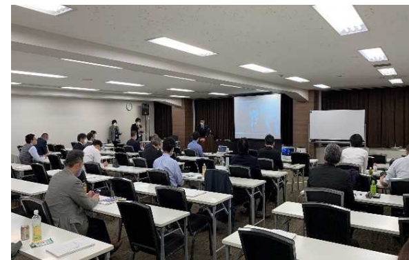
第27回PPP/PFI検討会 (令和3年12月)の様子