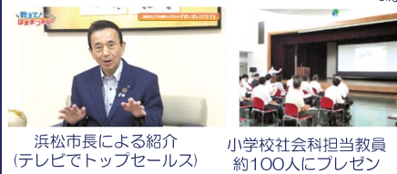
浜松市長による紹介（テレビでトップセールス）