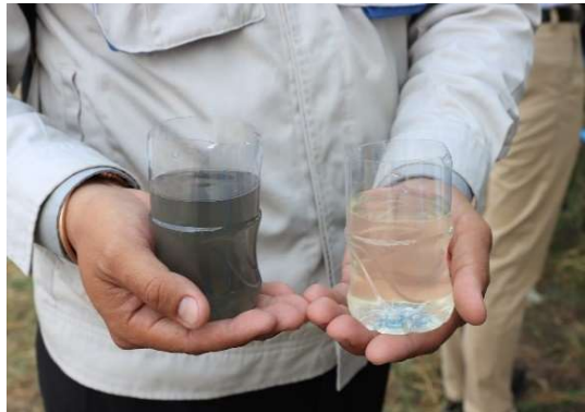
流入水及び処理水