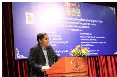
タケオ州副知事挨拶