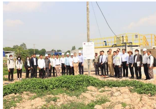
実証サイト集合写真