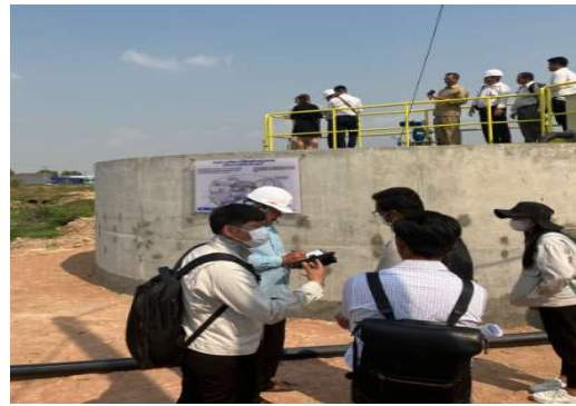
実証サイト視察の様子