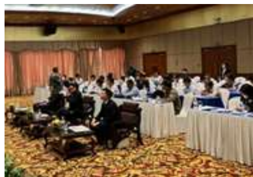
セミナー会場の様子