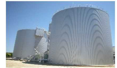
汚泥消化施設の導入によるバイオガス発電 (○○○○t-CO 2 削減)