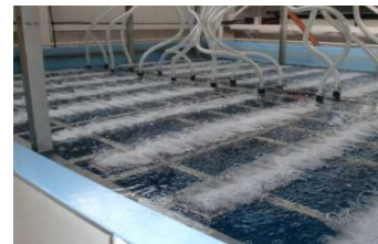
超微細散気装置導入による省エネ化 (○○○t-CO 2 削減)