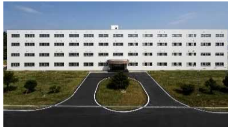
【建替後のイメージ(庁舎)】