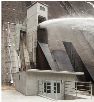
【発電設備の新設・増強】