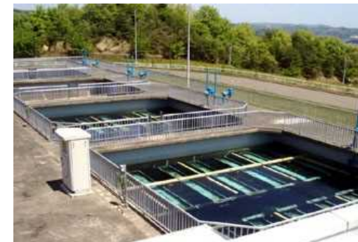
宮城県 上・工・下水道一体コンセッション