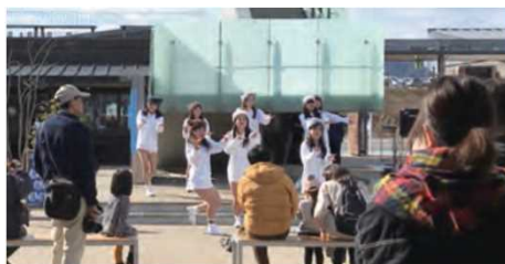
【本道の駅を拠点とする地元アイドル】