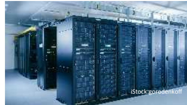
【データセンター等を誘致し地域振興】