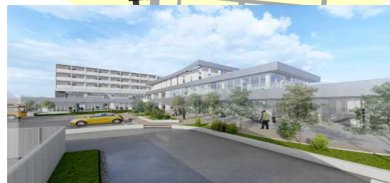
【リーディング施設①】