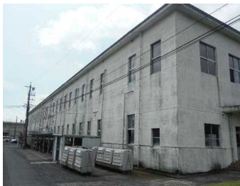
【現状施設の例(庁舎)】