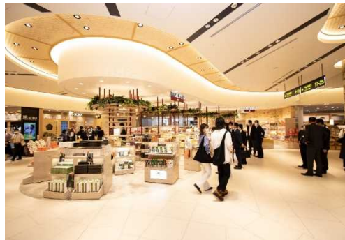
関空・伊丹空港コンセッション