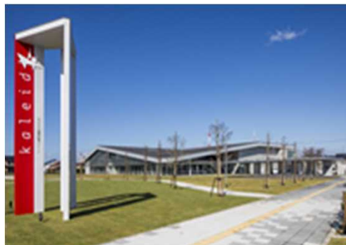
ののいち 石川県野々市市 図書館等複合施設