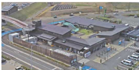
【外観(飲食施設・防災倉庫等)】