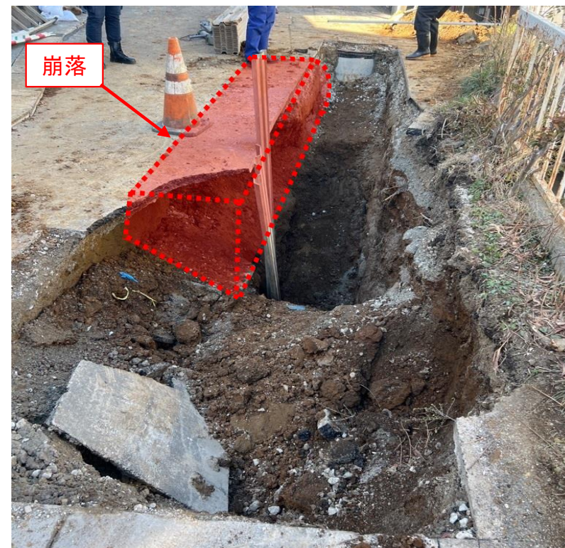
側面の地山が崩落し、作業員が埋められた。