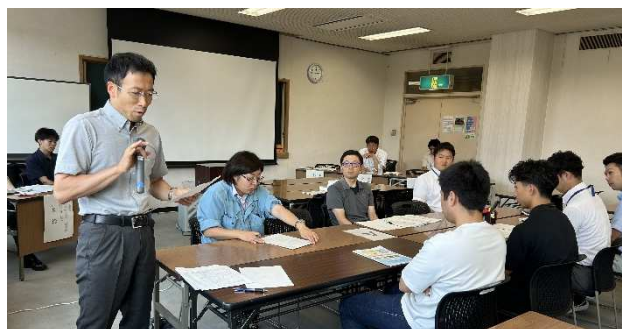
代表者による発表状況