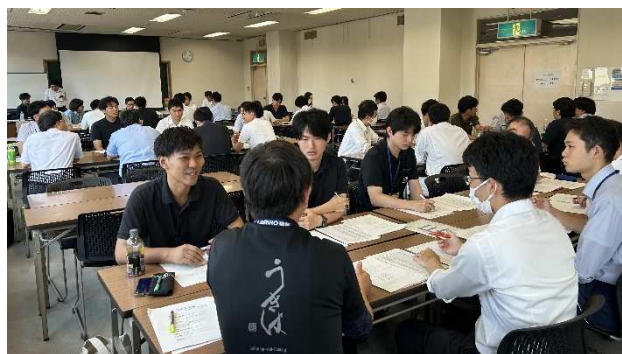
グループディスカッションの様子

その後、福岡県宇治山係長から、グループディスカッションについての講評をいただきました。