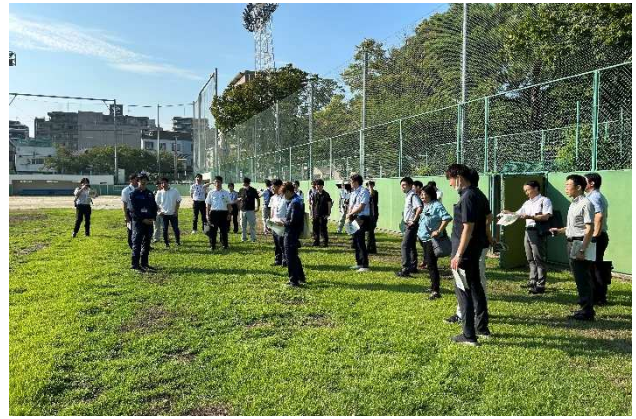
「山王1号雨水調整池」施設見学状況