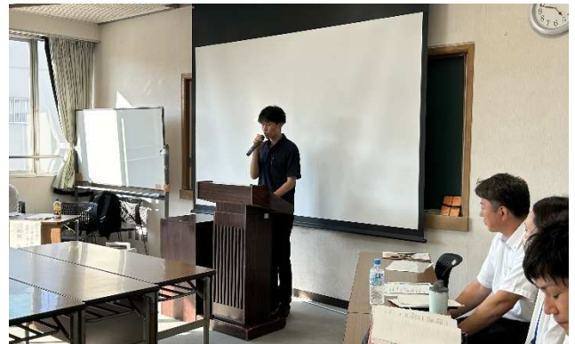
九州地方整備局袴田係長による講評

この下水道場で学んだことを活かして、今後の下水道事業に携わって行ってほしいなどの助言をいただきました。