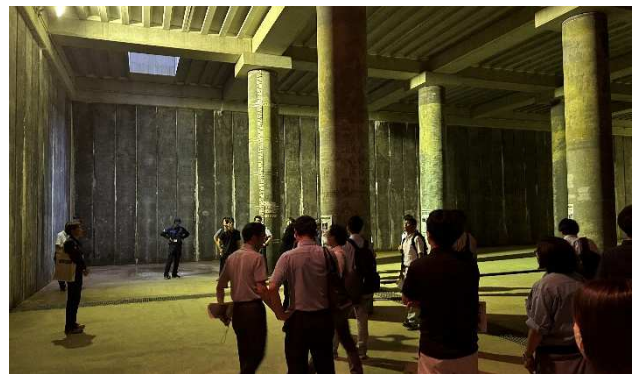
「山王2号雨水調整池」施設見学状況