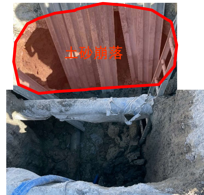
背後の地山が崩落し、作業員が埋められた。