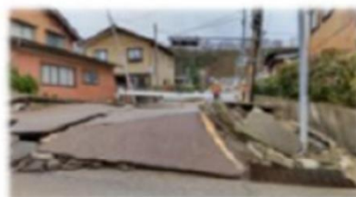
能登半島地震の被災写真