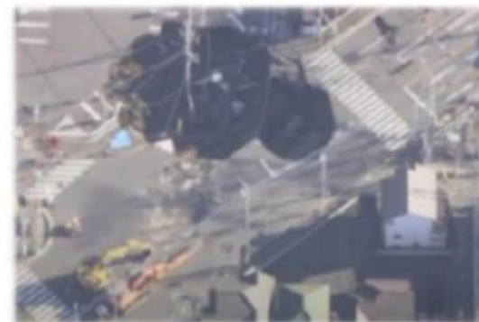
八潮市道路陥没事故の状況写真 (1月31日時点)