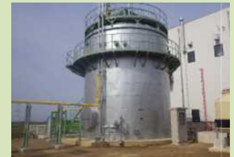
下水道施設におけるバイオマスメタン発酵事業