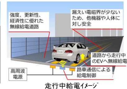
走行中給電イメージ