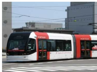
LRT (Light Rail Transit)