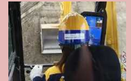
ICT施工(3次元データを重機に読み込み確認しながら施工)