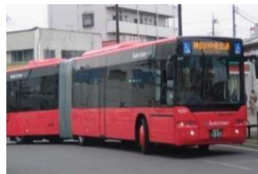
BRT (Bus Rapid Transit)