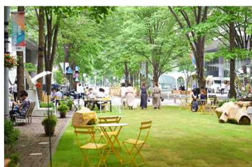
Marunouchi Street Park 2020