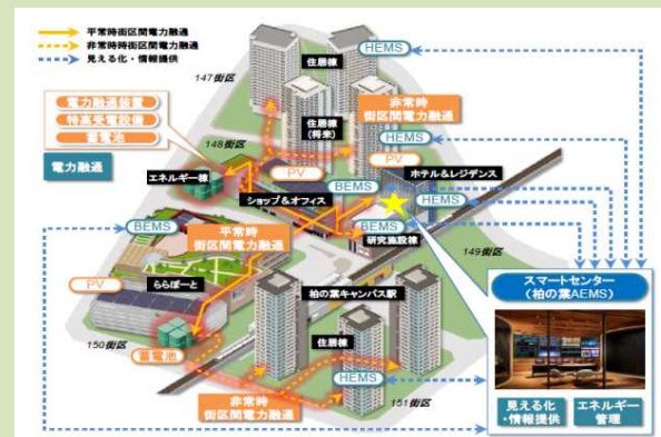
柏の葉スマートシティの取組