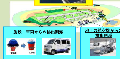
施設・車両からの排出削減