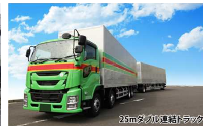
ダブル連結トラック