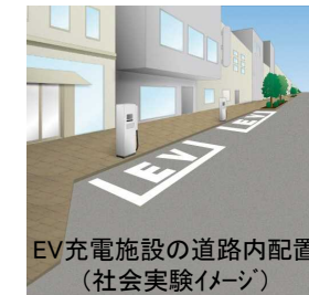
EV充電施設の道路内配置 (社会実験イメージ)