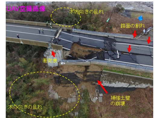
橋台周辺地盤の影響を受けて橋台が移動、残留変位が生じた事例