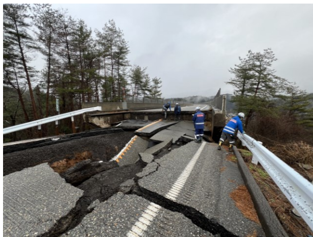
隣接構造物相互の影響を考慮すべき例 例: R6能登大橋接続部