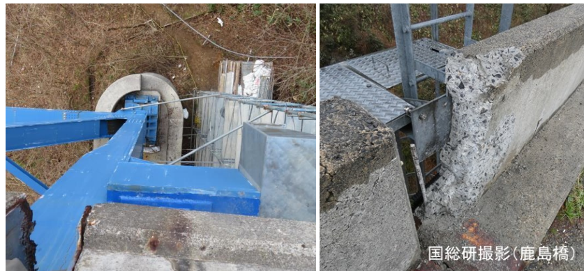
検査路がそもそも無かったり、検査路を設けていても使えなかったため、状態の把握に時間を要した事例