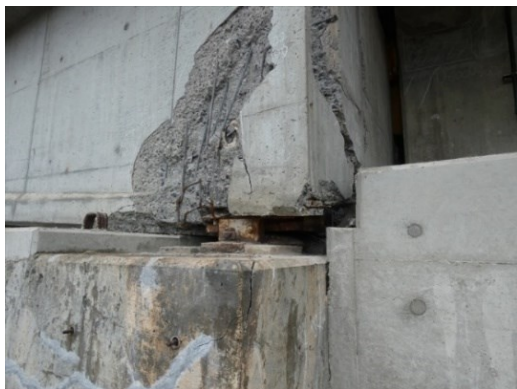
桁端と支承が同時に破壊した事例