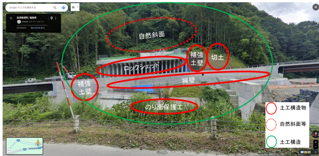
隣接する複数の土工構造物とその周辺の自然斜面を含めた検討が必要な例