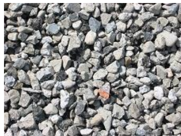
再生クラッシュラン