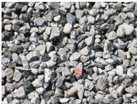
再生クラッシュラン