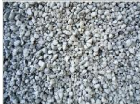
再生コンクリート骨材