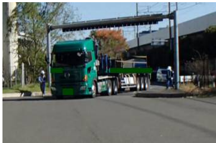
①【東京国道事務所】辰巳車両取締基地