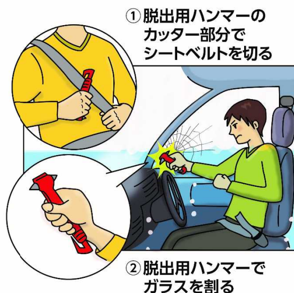
脱出用ハンマー、シートベルトカッターの使い方 (JAF ホームページより)