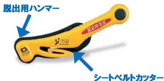
脱出用ハンマー、シートベルトカッターの例