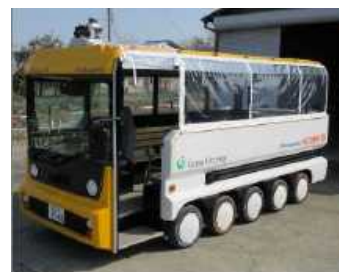
【実験車両】 eCOM10(自動運転機能を搭載した低速電動バス) 【走行条件】 ・テストドライバー乗車有 ・モニター乗車有 ・自動運転レベル2相当(特定条件下での自動運転)