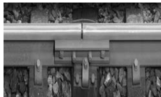
国土交通大臣賞 保線におけるIoT技術の実用化とメンテナンスへの応用 東日本旅客鉄道(株)ほか