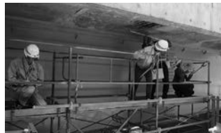
文部科学大臣賞 大学研修施設(大規模実橋モデル)を活用した「臨床型」の橋梁維持管理技術者育成 名古屋大学大学院 工学研究科土木工学専攻 橋梁長寿命化推進室