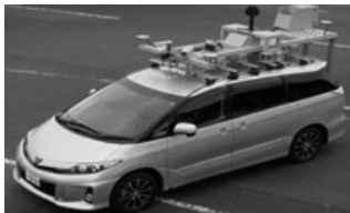
総務大臣賞 電柱点検の効率化に向けた構造劣化判定技術の実用化 日本電信電話(株)アクセスサービスシステム研究所