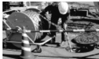
国土交通大臣賞 下水道圧送管路における硫酸腐食箇所での効率的な調査技術 (株)クボタ