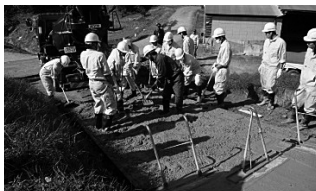
農林水産大臣賞 手造り公共事業 えな土地改良区