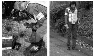
厚生労働大臣賞 時間積分式漏水発見器による効率的な漏水発見手法(スクリーニング工法) 東京水道サービス(株)