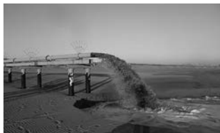
農林水産大臣賞 漁港の砂堆積と砂浜侵食を同時に保全する ジェットポンプ式サンドバイパスシステム 静岡県一一般財団法人漁港漁場漁村総合研究所・五洋建設(株)