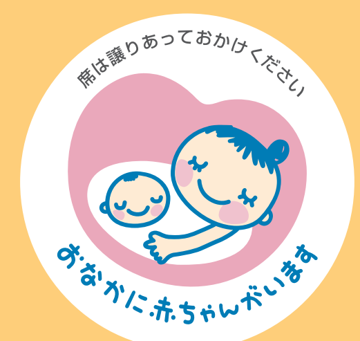
マタニティ マーク