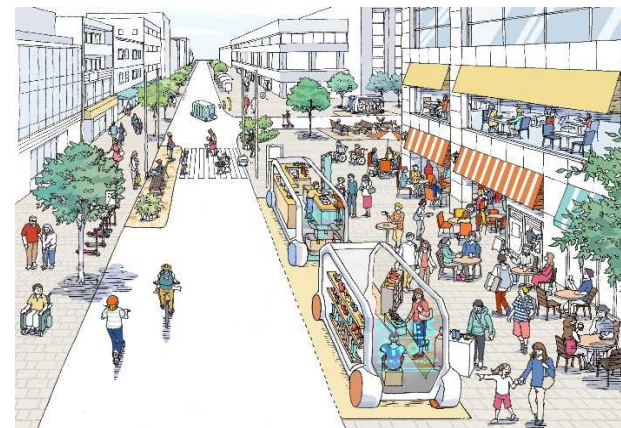
店舗(サービス)の移動