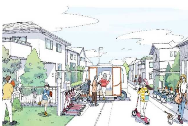
マイカーを持たなくても便利に安心して移動できる モビリティサービス