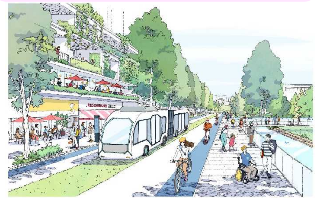
BRT(バス高速輸送システム)や自転車等を中心とした低炭素な交通システム