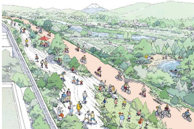
公園のような道路