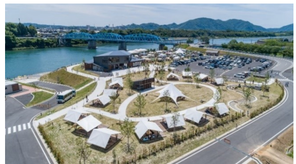
美濃加茂地区かわまちづくり(岐阜県美濃加茂市)