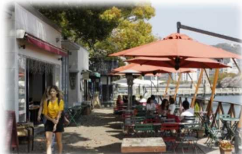
オープンカフェの設置 (京橋川 / 広島市)