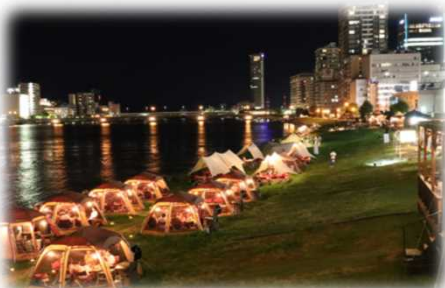
民間事業者の参加 (信濃川 / 新潟市)