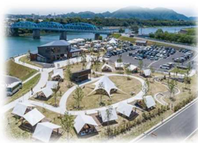
賑わい拠点の整備 (木曾川 / 美濃加茂市)