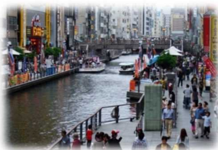
遊歩道の民間活用 (道頓堀川 / 大阪市)