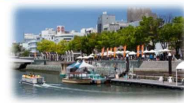
親水護岸の利用 (新町川 / 徳島市)