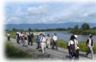
河川管理用通路の利用 (最上川 / 長井市)