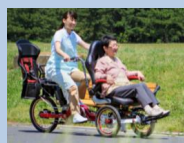
前輪2輪電動アシスト自転車