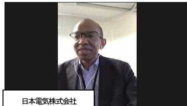
日本電気株式会社