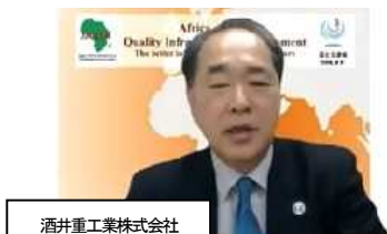
酒井重工業株式会社