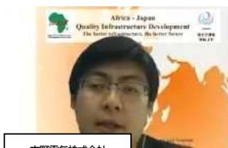
古野電気株式会社