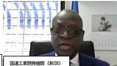
国連工業開発機関 (UNIDO)