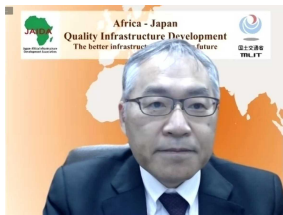
石原海外プロジェクト審議官による挨拶