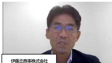
伊藤忠商事株式会社