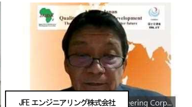
JFE エンジニアリング株式会社