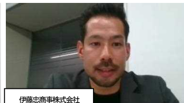
伊藤忠商事株式会社