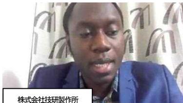
株式会社技研製作所