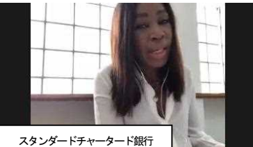
スタンダードチャータード銀行