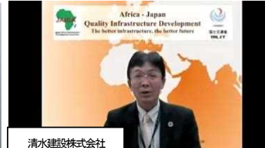
清水建設株式会社