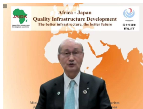
アフリカ・インフラ協議会宮本会長による挨拶