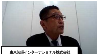
東京製綱インターナショナル株式会社