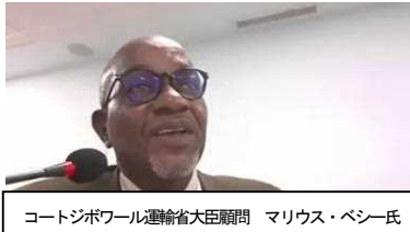
コートジボワール運輸省大臣顧問 マリウス・ベシー氏