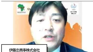
伊藤忠商事株式会社