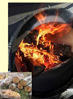
再生可能エネルギーの利用