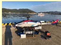
ドローンによる物流のイメージ

ドローンの導入実験により、以下の項目を検証。 ・導入に適した機材の選定 ・目視外飛行のための遠隔監視体制の確立 ・採算性の検証 など