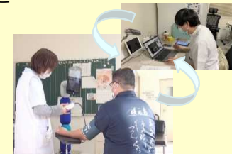
オンライン診療の様子

遠隔医療の導入やドローンによる検査キット・検体等の医療物資の輸送補完の検証 ・住民の利便性や実施体制の検証 など