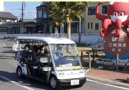
グリーンスローモビリティのイメージ

自動運転グリーンスローモビリティ導入実験により以下の項目を検証。 ・観光客・住民の利便性向上 ・運行ルート、頻度の設定 ・ICTを活用した運行監視 ・採算性の検証 など