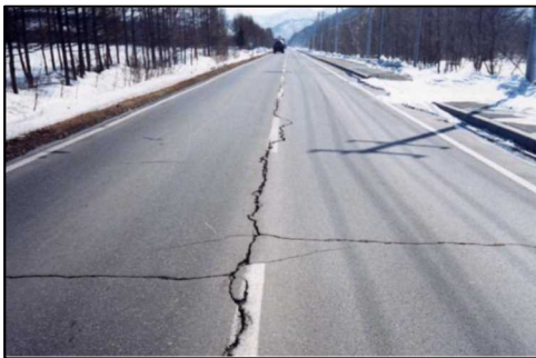
車道中央線に大きなひび割れ