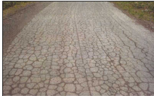
路面の亀甲状のひび割れ