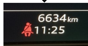
シートベルト警告灯