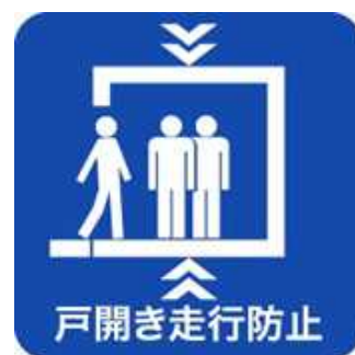
戸開走行保護装置設置済みマーク

本制度に関する詳細については、以下にお問合せください。 一般社団法人建築性能基準推進協会 電話：03-3513-7561 WEB： http://www.seinokyo.jp/