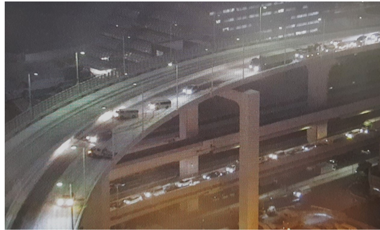
車両の滞留 ＜首都高速道路 台場線＞