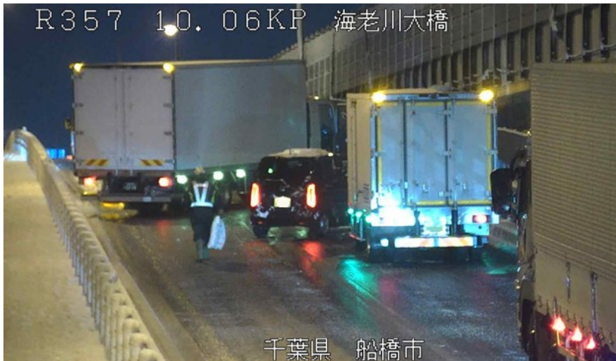
冬タイヤやチェーン未装着車両によるスリップ事故 ＜国道357号＞