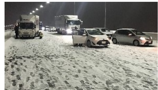
首都高速中央環状線の立ち往生発生状況 ＜令和4年1月6日＞

○このほか、主要な国道においても冬タイヤやチェーン未装着車によるスリップ事故が多発しました。