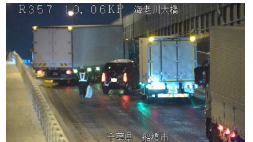
国道357号 路面凍結によるスリップ事故 ＜令和4年1月7日＞