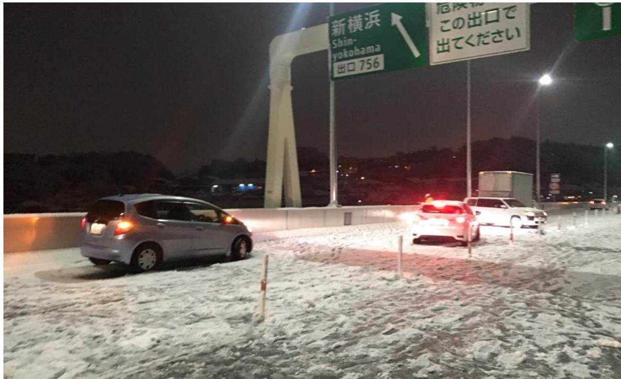
冬タイヤやチェーン未装着車両による立ち往生 ＜首都高速道路 横浜北線＞