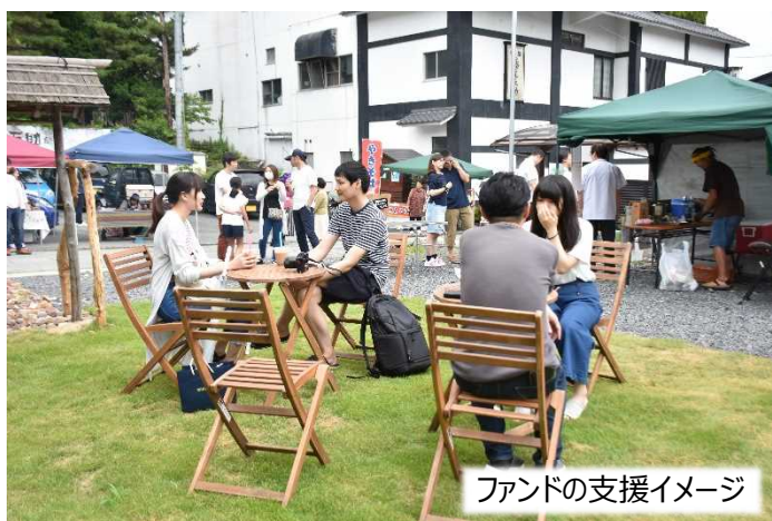
ファンドの支援イメージ

今後のまちづくりについてお悩みの場合には、お気軽に以下のお問い合わせ先までご相談ください。