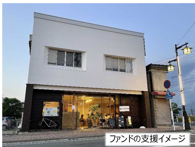
ファンドの支援イメージ