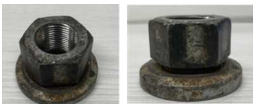
車輪脱落事故を起こした車両の ワッシャー付ホイール・ナット

このため、大型車のタイヤを脱着する際は、ホイール・ナットを清掃した上で、ナットとワッシャーの間を含めて適切に潤滑剤を塗布するとともに、劣化したホイール・ナットは必ず交換をお願いします。