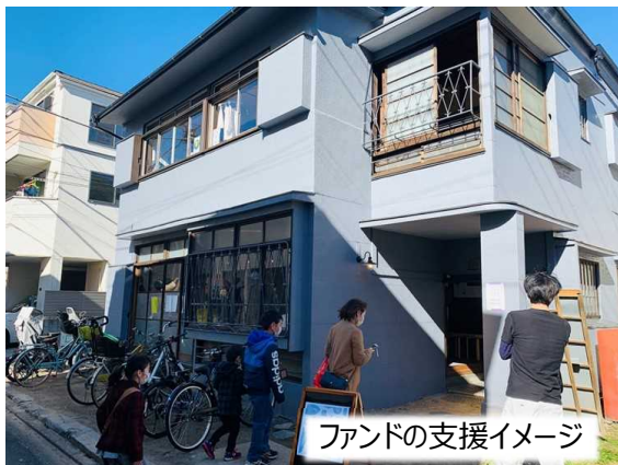
ファンドの支援イメージ