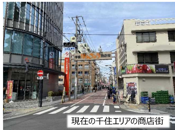
現在の千住エリアの商店街

今後のまちづくりについてお悩みの場合には、お気軽に以下のお問い合わせ先までご相談ください。