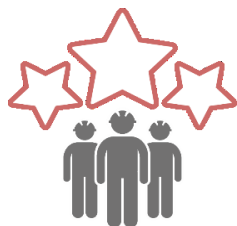
見える化評価制度 ロゴマーク