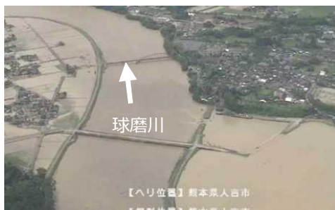
球磨川の氾濫状況（熊本県人吉市）

※1 死者・行方不明者数は、「令和2年7月豪雨による被害及び消防機関等の対応状況（第57報）」（消防庁作成）の数値を使用しており、風害等によるものを含む数値である。