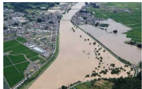
最上川の氾濫状況（山形県大石田町）